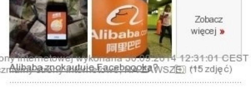
Alibaba znowu w Facebooku (15 zdjęć)