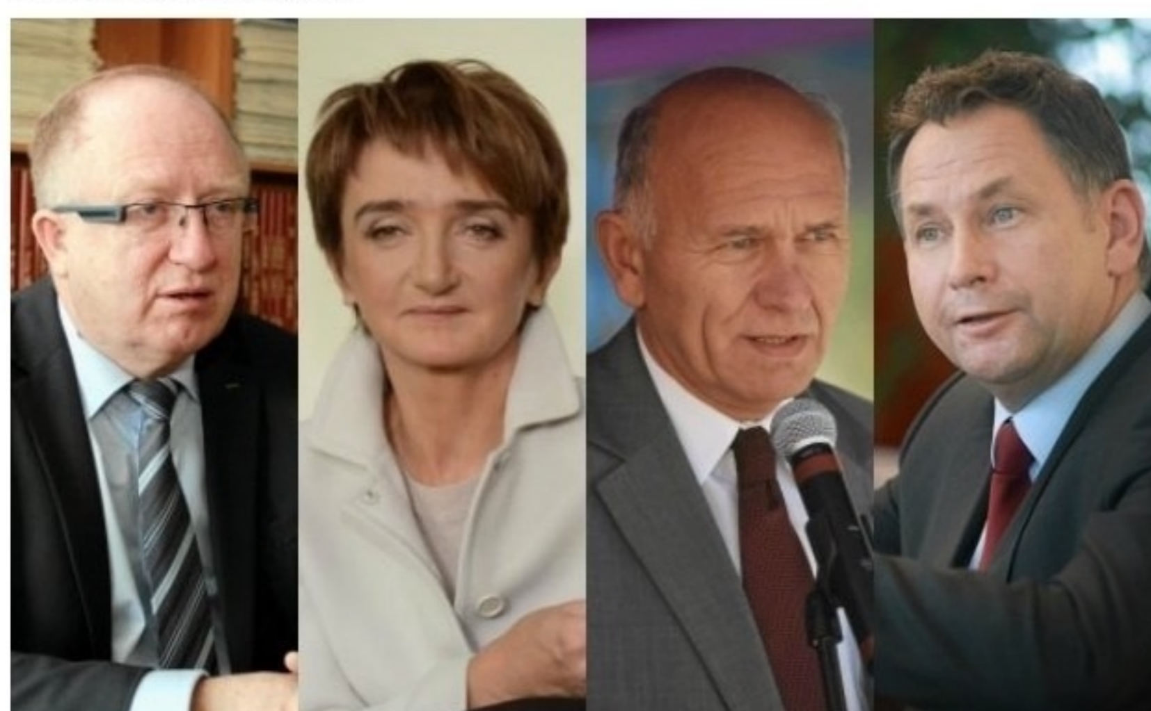
Zarobki członków zarząd (Gazeta.pl)