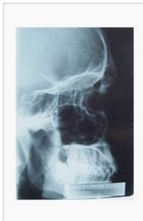
Zdjęcie RTG boczne uwidaczniające zatoki przynosowe