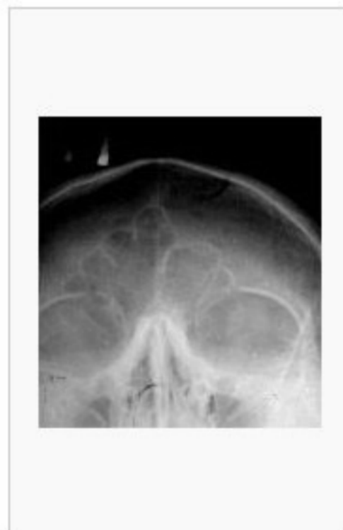
Zdjęcie RTG celowane na zatoki czołowe