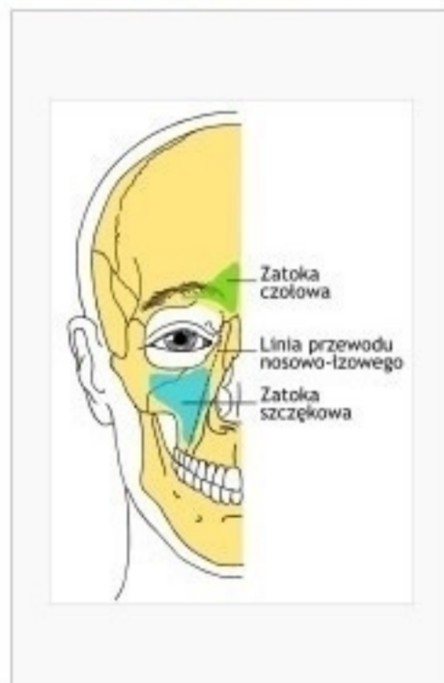
Rysunek lokalizacji zatok przynosowych