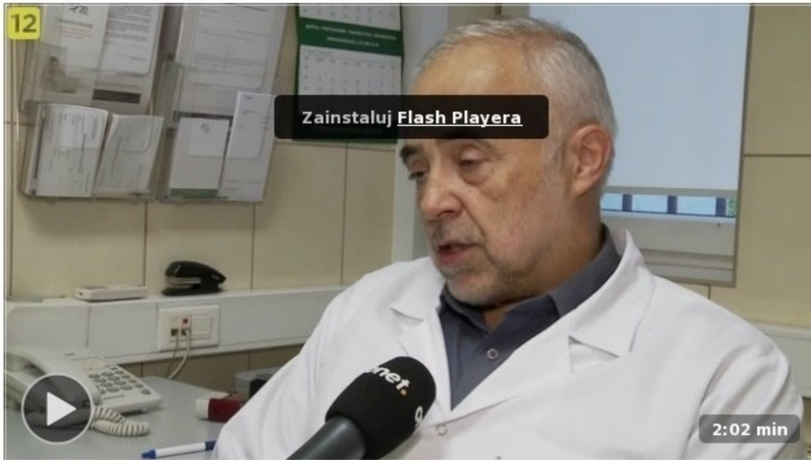
Anna Przybylska zmarła na raka trzustki. Co o tej chorobie mówią lekarze - Onet.