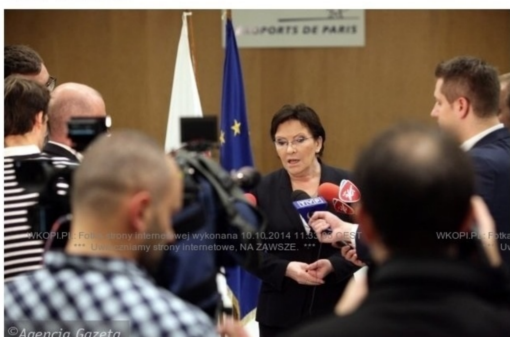
Ewa Kopacz i Francois Hollande.