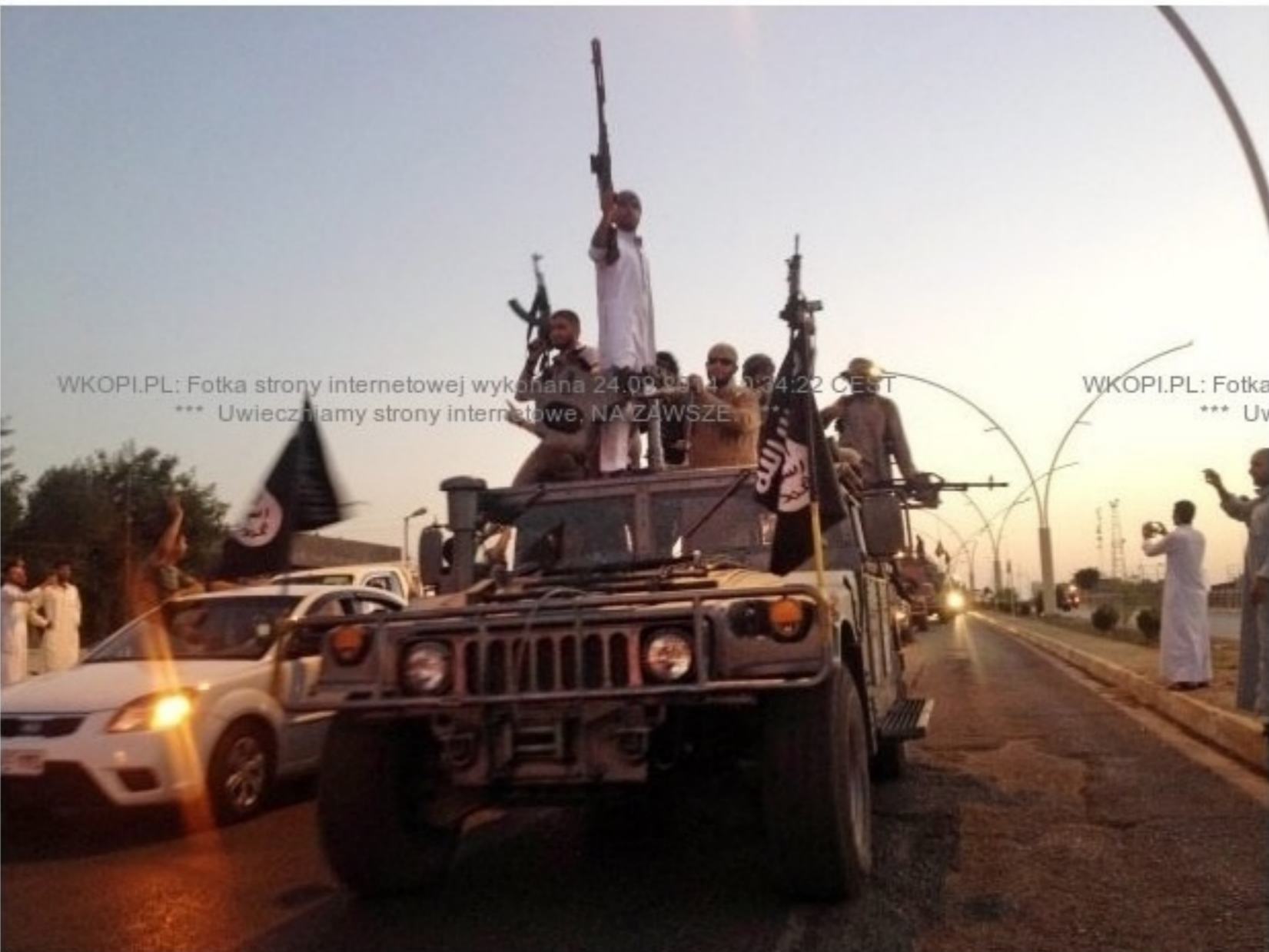
Bojownicy Państwa Islamskiego przejęli pojazd sił iracki